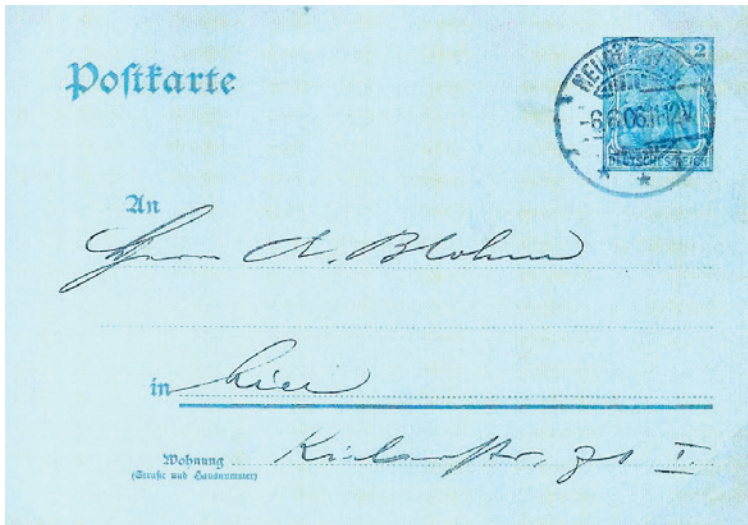
Postkarte aus Neumünster aus dem Gründungsjahr des Vereins 1906