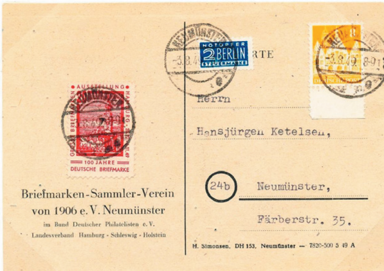
Ortspostkarte des Vereins mit Vignette der Ausstellung „100 Jahre Briefmarken“ 1949, gerichtet an ein Mitglied des Rundsendeverkehrs.