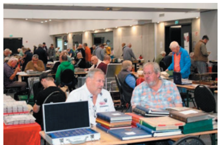
Bilder vom Deutsch-Niederländischen Tauschtag im September 2025. Hier wird auch die Nordwestdeutsche Sammler-Börse an Himmelfahrt 2026 stattfinden.

Coronabedingt konnte erst Himmelfahrt 2022 die zweite Nordwestdeutsche Sammler-Börse durchgeführt werden. Trotz zwei Jahren Zwangspause konnte sie an den Erfolg von 2019 anknüpfen, und auch 2023, 2024 und 2025 wurden erfolgreiche Sammler-Börsen durchgeführt. Wie bereits vorher die Deutsch-Niederländischen Tauschtage, zieht jetzt auch die Sammler-Börse nach Ostrhauderfehn um. Es hat sich gezeigt, dass das Vereins- und Gemeindezentrum für solche Veranstaltungen besonders gut geeignet ist. Die Halle ist ebenerdig, geräumig und hell, und rundum sind ausreichend Parkplätze vorhanden. Deshalb sind die Veranstalter zuversichtlich, dass auch die sechste Sammler-Börse an Himmelfahrt 2026 in Ostrhauderfehn von den Sammlerinnen und Sammlern angenommen wird.