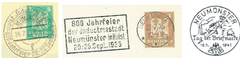
Sonder- und Werbestempel zum Stadtjubiläum 1925 und zum Tag der Briefmarke 1941

Die noch vorhandene Protokollführung datiert aus dem April 1911, von 1915 bis 1919 ruht die Protokollführung, vermutlich kriegsbedingt. Im Jahre 1926 verzeichnet der Verein bereits 32 Mitglieder und tritt dem Bund Deutscher Philatelistenverbände bei. In den Folgejahren schwankt die Mitgliederzahl und wird 1930 mit 30 angegeben. In den Jahren seit der Gründung gibt es zahlreiche gemeinsame Veranstaltungen, Knobelabende, Grünkohlessen mit Verlosungen, wobei durch den Losverkauf auch die Vereinskasse aufbessert wird.