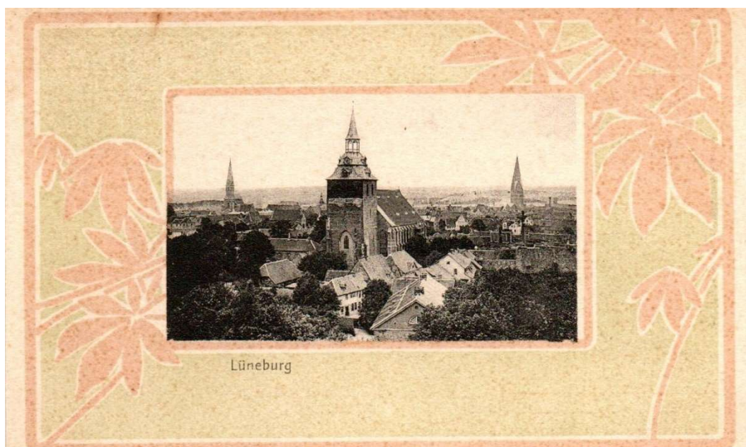
Ansichtspostkarte mit der St. Michaelis-Kirche zu Lüneburg.

Willkommen in Lüneburg zum Landesverbandstag 2023 des Philatelistenverbandes Norddeutschland e.V. am Sonntag, 02. April 2023, 10 Uhr, „Vitalissimo“, Uelzener Str. 90, 21335 Lüneburg