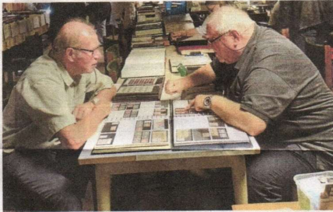
Handeln und Lücken füllen: Zwei Männer fachsimpeln bei einer Briefmarkenbörse in Harsefeld.